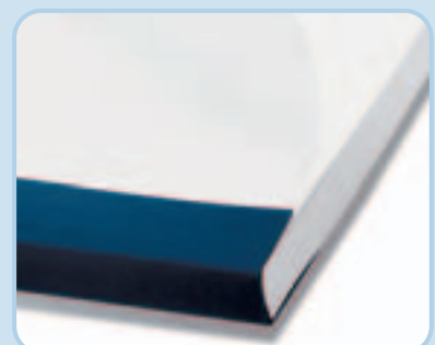
Gebundene Bindomatic-Mappe mit akkurat ausgerichtetem Papier und sauberer Rückenkontur