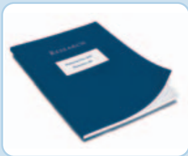
Individuell gestaltete Mappe – Design nach Ihren Vorstellungen