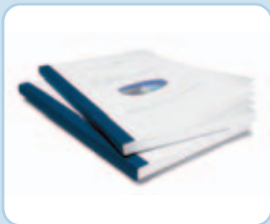
Standardmappen – hier in der Ausführung Aquarelle