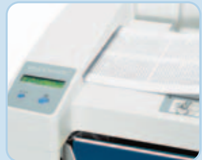
Im Size-Selector wird die passende Mappengröße bestimmt