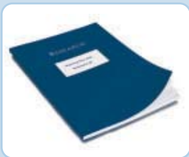
Individuell gestaltete Mappe – Design nach Ihren Vorstellungen