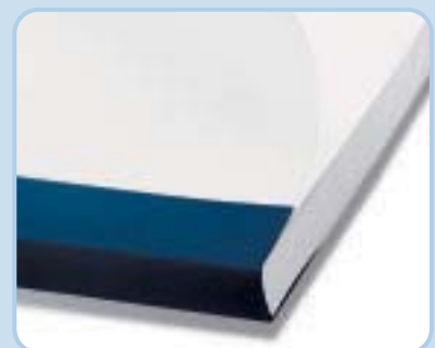
Gebundene Bindomatic-Mappe mit akkurat ausgerichtetem Papier und sauberer Rückenkontur