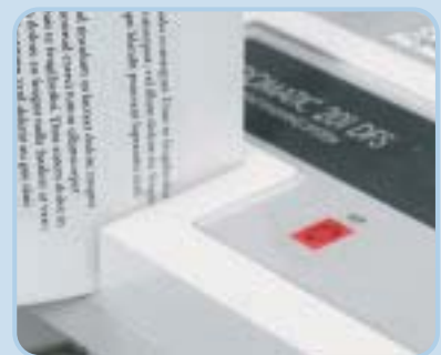
Im Size-Selector wird die passende Mappengröße bestimmt