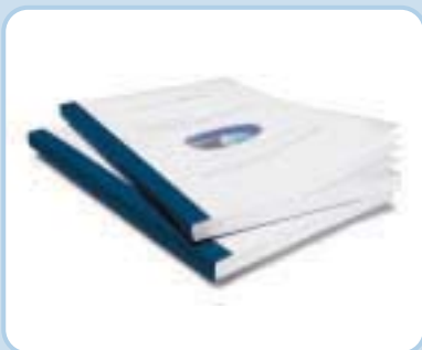
Standardmappen – hier in der Ausführung Aquarelle