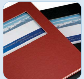
Fensterposition: Fenstergröße: 142 x 107 mm Abstand vom oberen Rand: 45 mm Abstand zum rechten Rand: 33 mm

Mit einer Fensterstanzung auf der Frontseite für die individuelle Gestaltung des Deckblattes. Erhältlich ist dieses Hardcover standardmäßig, wie alle Ambassador Hardcover, in zwei Farben - Schwarz und Dunkelblau. Weitere Farben sind auf Anfrage erhältlich.