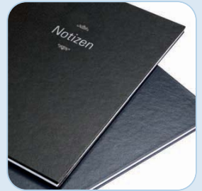
durchgehend lederähnliche Struktur

Gerne personalisieren wir Ihre Mappe, durch einen hochwertigen Heißfoliendruck (z.B. Firmendaten, Logo, etc.).