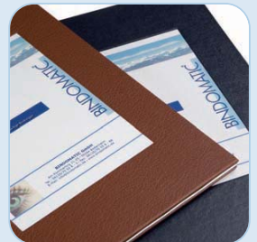
mit selbstklebendem Label für individuelles Design

Mit dem selbstklebenden Label, das natürlich im Lieferumfang enthalten ist, können Sie Ihr individuelles Design auf allen digitalen Farbdruckern auf dem Markt drucken. Nach dem Druck ziehen Sie das Label aus der vorgestanzen Fläche des DIN A4 Blattes und kleben es in den vertieften Bereich auf der Frontseite zur exakten Platzierung des Aufklebers.